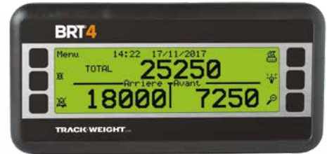
Affichage selon les préférences de l'utilisateur

La pesée s'effectue de manière automatique à l'aide de capteurs installés aux essieux ou encore à la suspension à air des camions. Selon le type de camion, un moniteur mesure en temps réel les flexions de l'acier, affichant le poids total par groupe d'essieux. L'étape pour transformer un camion ou une semi-remorque en balance embarquée est très facile. L'installation peut se faire par vous-même ou par l'un de nos spécialistes et ce, partout au Québec!